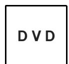
(CSP学齢期版Ⅲ研修参加者専用テキストセット)