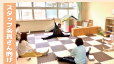
スタッフ会員さん向け

毎回テーマを変え、スタッフ会員さん同士が交流できるサロンとして開催しています(最近では「楽しい食卓」や「簡単ストレッチ」など)。息抜きの場としてお越しいただけると嬉しいです。