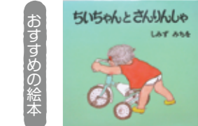
「ちいちゃんさんりんしゃ」/ほるぶ出版