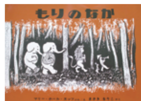
「もりのなつか」/福音館書店