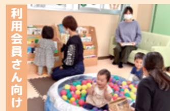
利用会員さん向け

親子で集うひろばを月に1回程度開催しています。アドバイザーも常駐してお待ちしております。